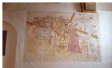
Fra Falkonergården og Sorø Klosterkirke